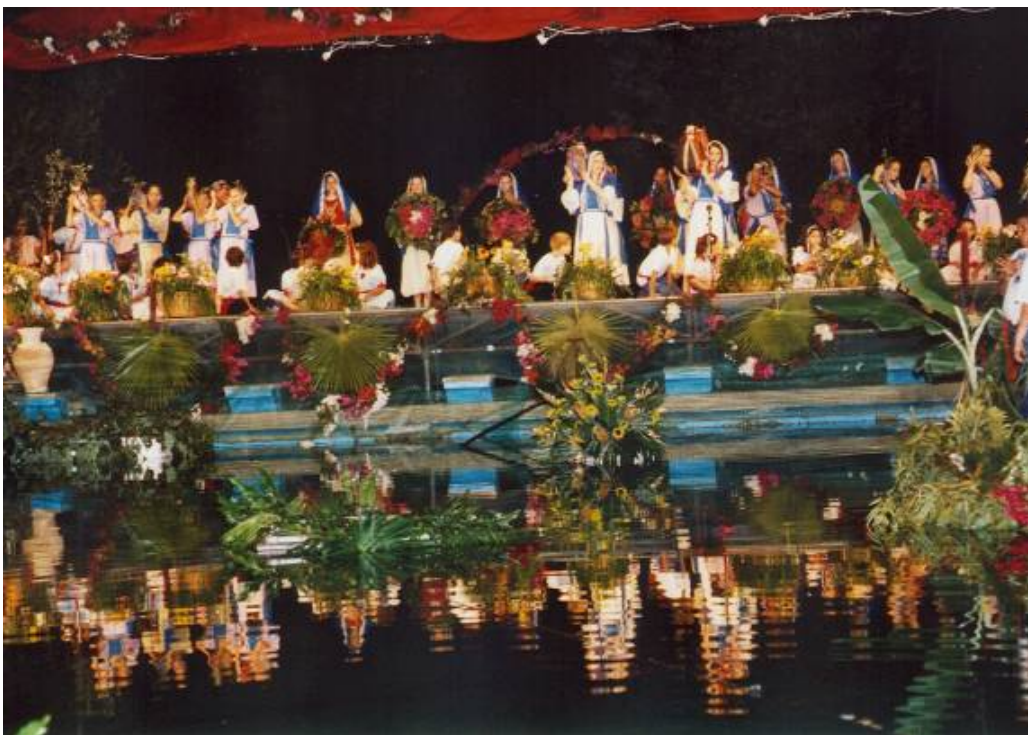
Fiesta del agua en Ramat lojanán. Apertura de la ceremonia: cuadro de la abundancia.