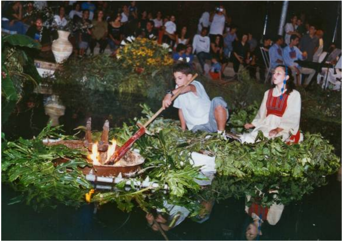
Fiesta del agua en Ramat lojanán: encendido de las antorchas en la fuente por niños en una balsa, años '90.