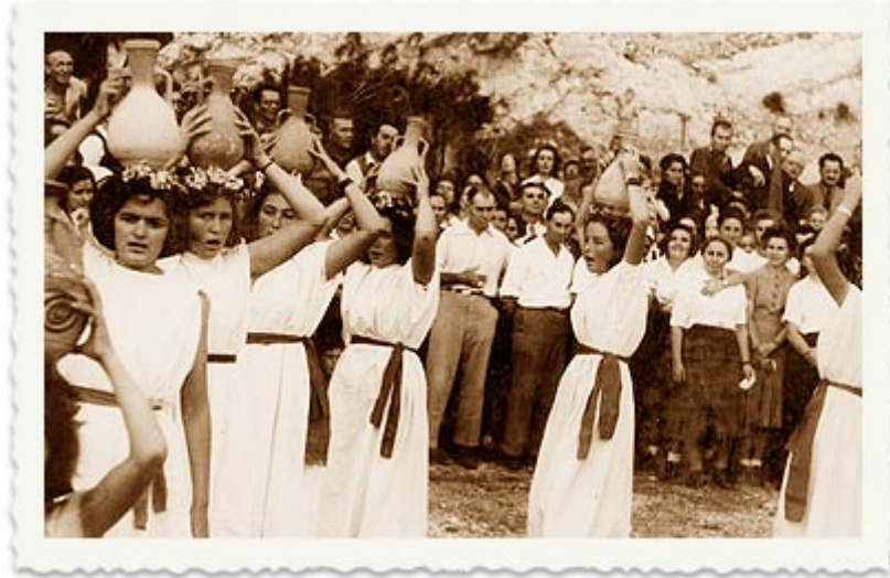
Fiesta del agua en Guinegar, años '30

Kibbutz Institute for Holidays and Jewish Culture